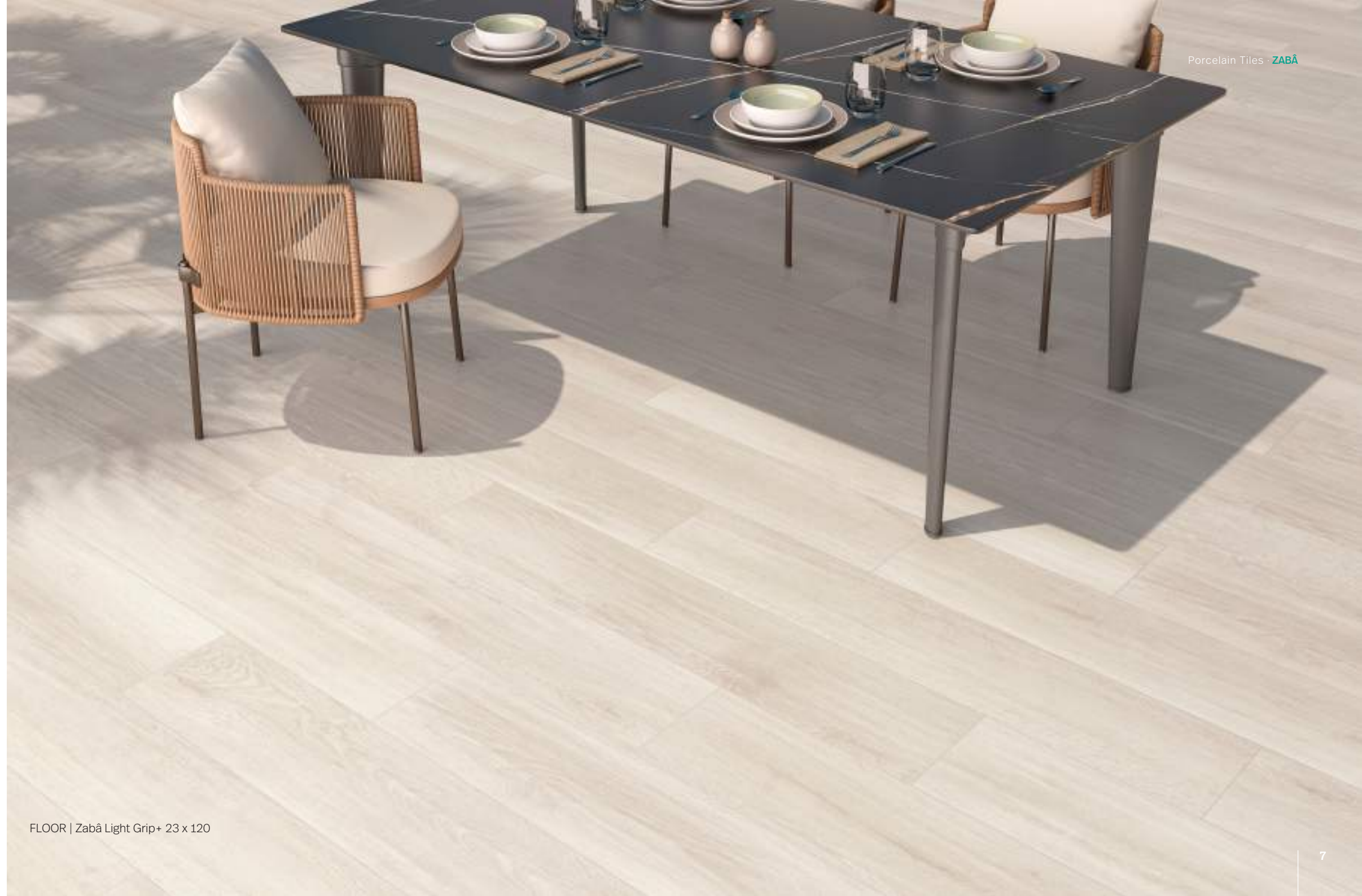
FLOOR | Zabā Light Grip+ 23 x 120