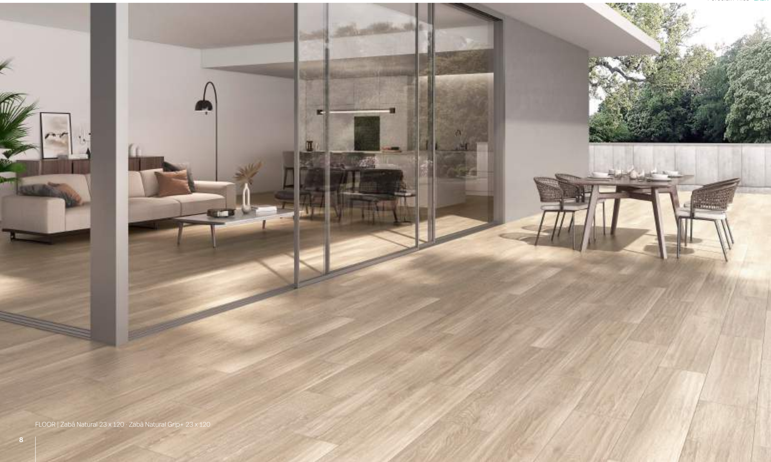
FLOOR | Zabā Natural 23 x 120 · Zabā Natural Grip+ 23 x 120