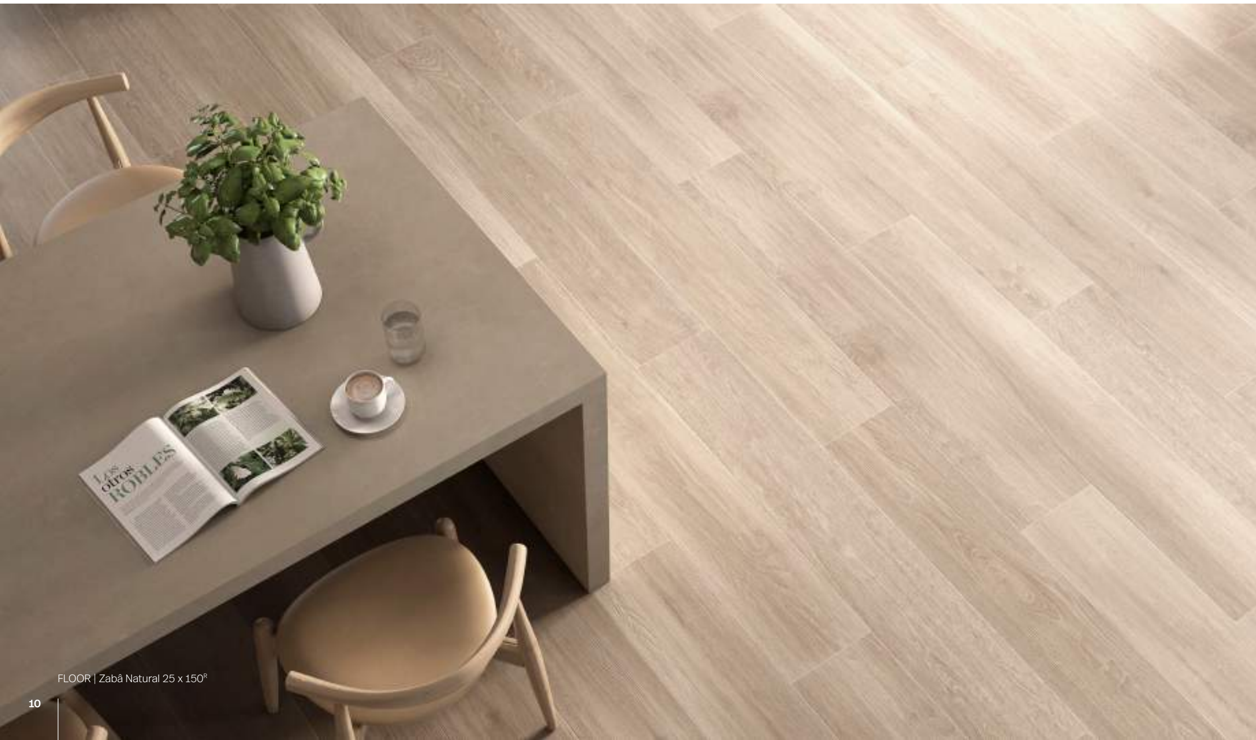
FLOOR | Zabā Natural 25 x 150 2