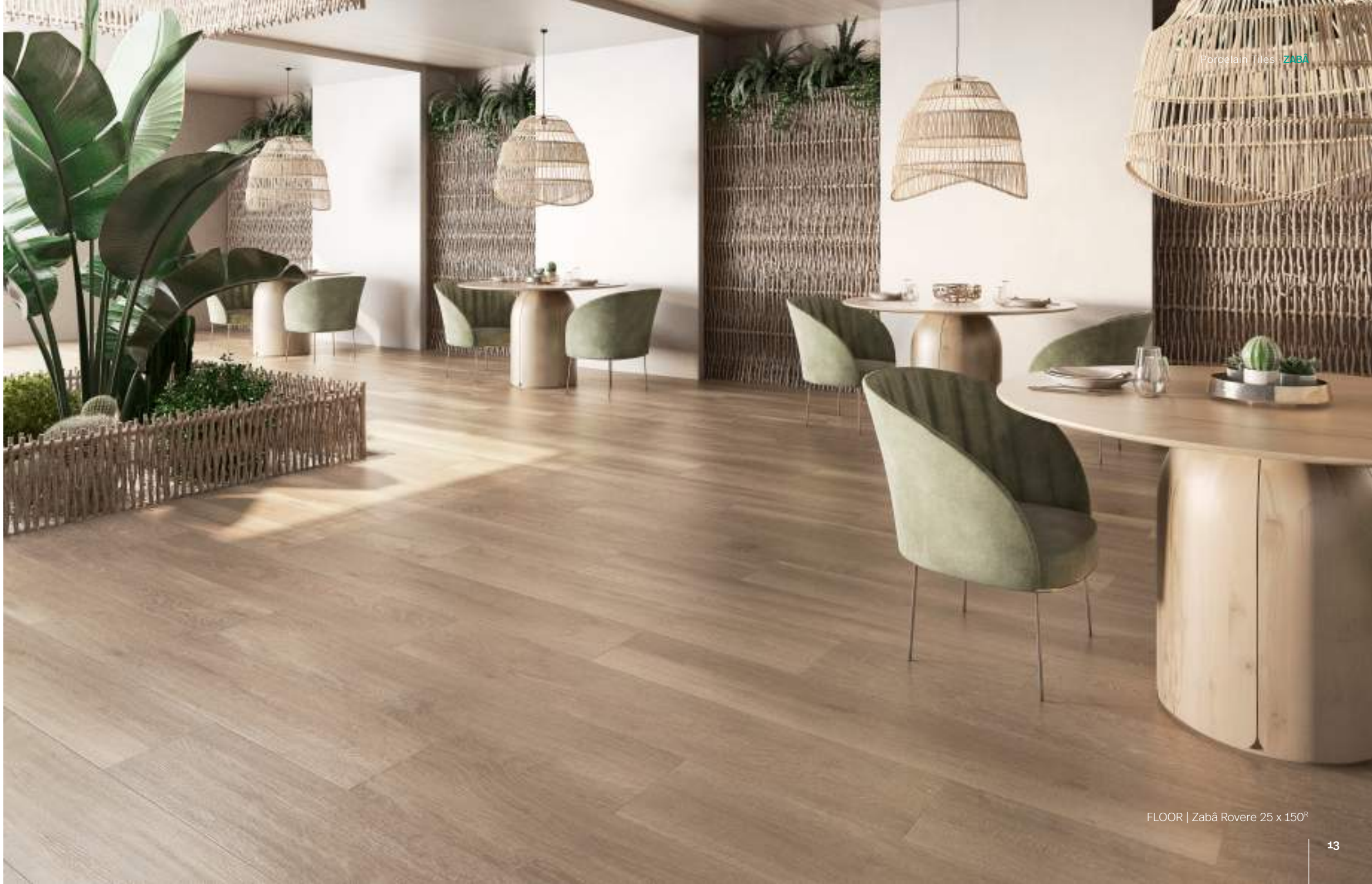
FLOOR | Zabá Rovere 25 x 150 R